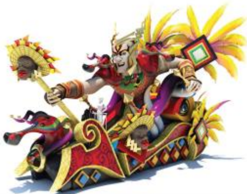
Personaje: Carolina Cruz Patrocina Caracol