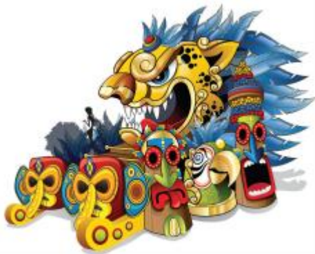
Personaje: Reinas y capitanas de Aciba Patrocina Pacific Rubiales

América precolombina es el nombre que se da a la etapa histórica de nuestro continente, que comprende desde la llegada de los primeros seres humanos hasta el establecimiento del dominio político y cultural de los europeos sobre los pueblos indígenas americanos. En este diseño es una ilusión de máscaras, tótems o monumentos, que hubiesen podido ser