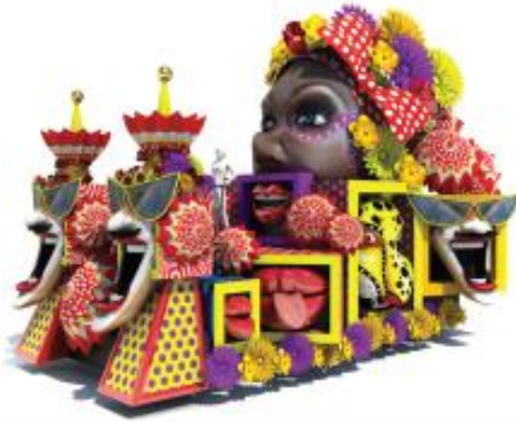
Personaje: Reina de Reinas 2014 Patrocina Éxito

Desde los años 70, una comparsa de alegres y coquetas mujeres le brindan felicidad a los desfiles del Carnaval, moviendo sus caderas, sus hombros y su piernas, al son del fandango o el porro. Comparsa inspirada en el arte y las tradiciones populares, retomando vestimentas sencillas y cotidianas, con las que aportan ritmo y sabor a la fiesta barranquillera. En nuestra fiesta, los danzantes suelen llevar como parafernalia tarros, palos y diversos objetos e intentan robarle pertenencias a los espectadores, imitando lo que hacen los micos en los pueblos, donde entran a las casas a robar comida u objetos llamativos.